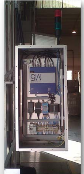
Solución RFID para garantizar la trazabilidad